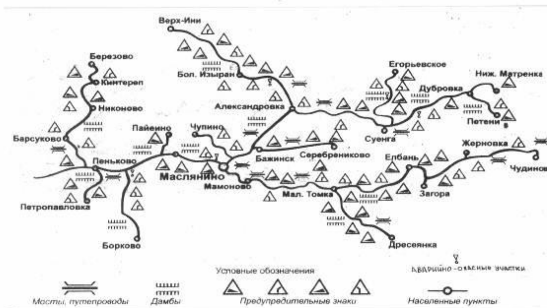
Схема автобусных маршрутов Маслянинского района